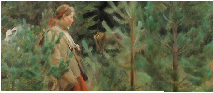
Vallflicka av Anders Zorn