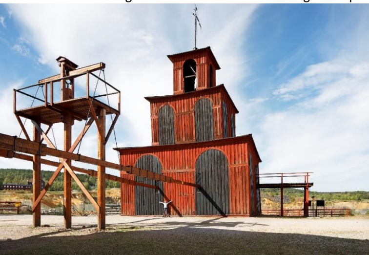
Gruvlaven i Falun lunch på närbelägna Geshwornergården.